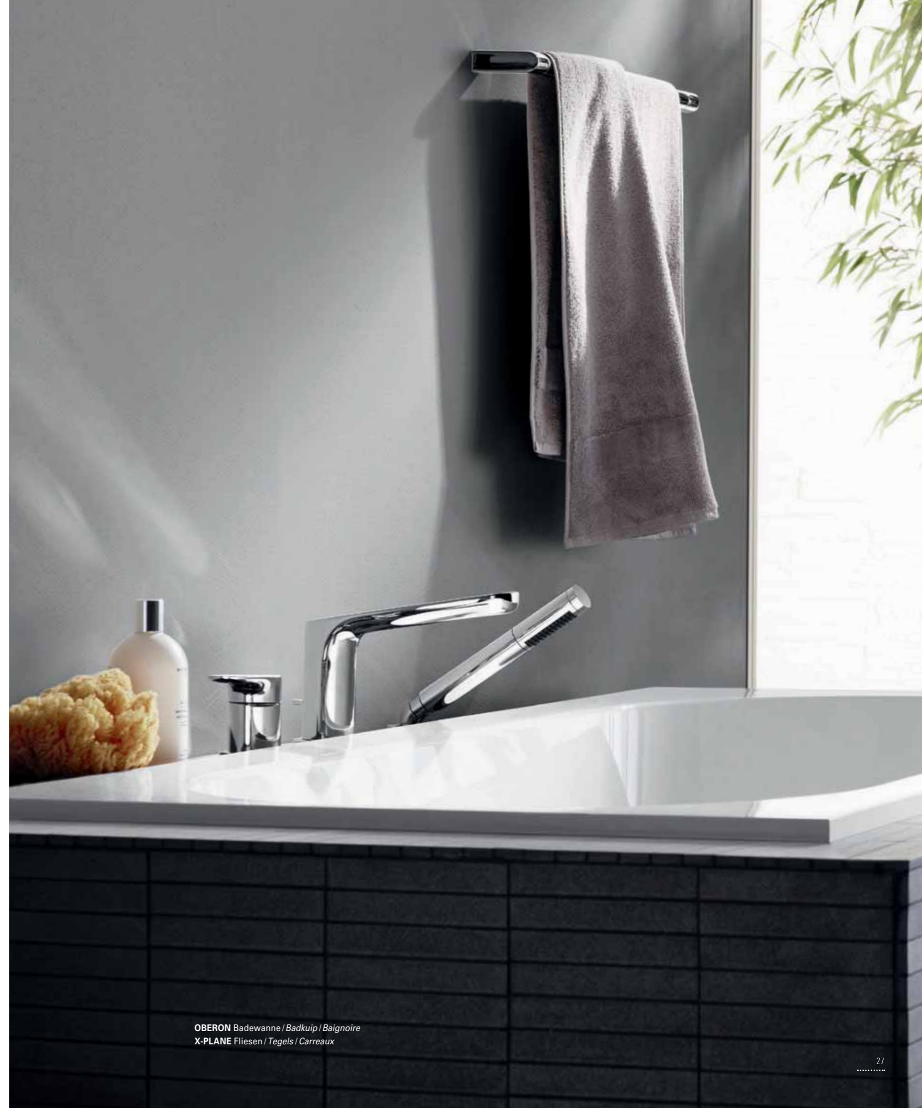
OBERON Badewanne / Badkuip / Baignoire X-PLANE Fliesen / Tegels / Carreaux