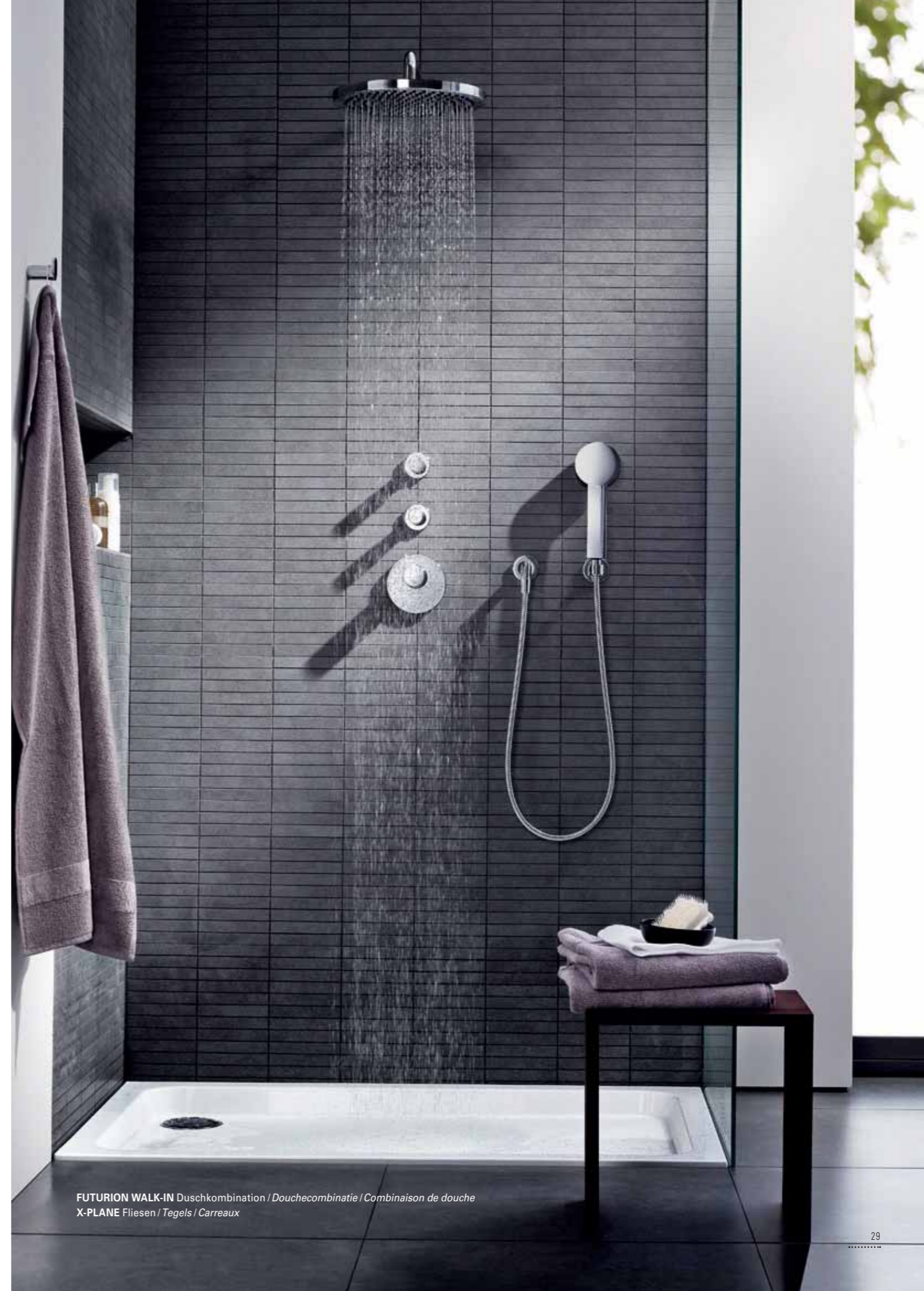
FUTURION WALK-IN Duschkombination / Douchecombinatie / Combinaison de douche X-PLANE Fliesen / Tegels / Carreaux

Avec L'Aura, la douche devient une expérience exaltante de la nature. Design minimaliste, confort généreux : la salle de bains révèle une dimension de qualité nouvelle et globale.