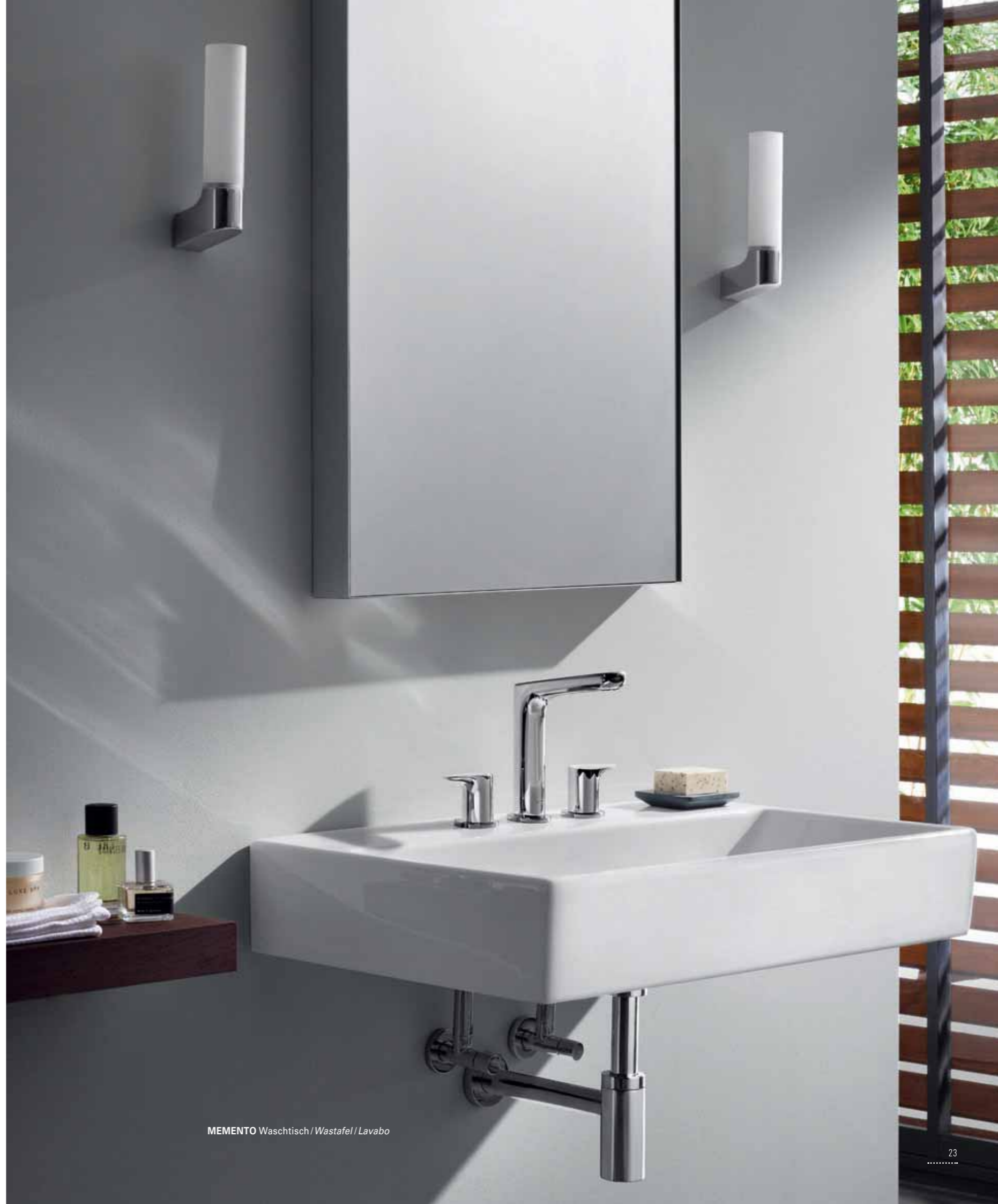
MEMENTO Waschtisch / Wastafel / Lavabo

L'Aura réunit les qualités esthétiques les plus diverses. Design moderne et intemporel, subtil et attrayant, naturel et urbain, prononcé et voluptueux : il possède tous les ingrédients pour devenir un classique moderne.